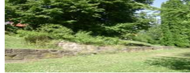
Obere Zuwegung zum alten Park

Die Anlage dieser Allee dürfte im Zusammenhang stehen mit der Anlage der Waldpromenaden am Brunnenberg . Sie bildete den natürlichen Zugang zum Friedrichsplatz.