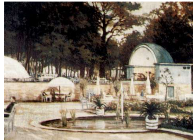
Musikpavillon und Fontänenbecken (Ölgemälde von 1935)

Vor allem zwischen 1750 und 1850 lockte der damals als „ Madeira des Nordens “ bekannte Kurort die hannoversche Aristokratie nach Bad Rehburg. Selbst das Hannoversche Königshaus hat hier „ der Gesundheit wegen und des Vergnügens halber “ seine Kuraufenthalte verbracht. Zu diesem klangvollen Namen u. Ausspruch trug sicherlich auch der Kur-Aufenthalt der hannoverschen Königin Friederike im Jahr 1840 bei.