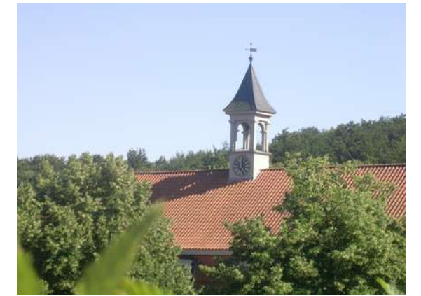
Ein zierlicher Glockenturm schmückt das Dach

Das Innere wurde mit zwölf „Badekabinetten“ ausgestattet. Diese sind noch heute zu besichtigen und berichten über die Badekultur des Zeitalters der Romantik , eine Einmaligkeit in Deutschland !