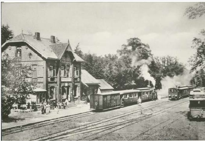
Alter Bahnhof Bad Rehurg

Ein Relief von ihr zusammen mit ihrer Schwester zeigt die letzte Spalte dieser Seite.