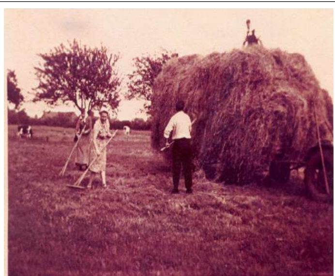
Bei der Heuernte, natürlich loses Heu !

Die mächtige Stallscheune steht im Dorfzentrum unmittelbar in der Nähe der Kreisstraße. Prägend für den Bau sind neben den großen Dielentoren der Giebel mit schönem Ziermauerwerk.