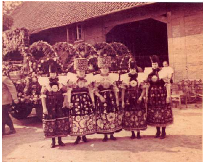
Trachtengruppe in Riepen auf Hof Nr. 15 (heute Riepener Str. 11)

Auf dem Dach befindet sich eine alte Wetterfahne. Die vier Pferde zeigen die Windrichtung an. Früher zierte solche Wetterfahnen häufig die großen Bauernhöfe.