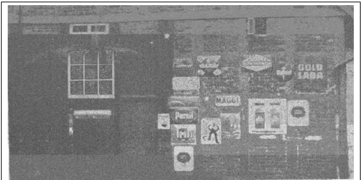
Außenansicht des Haushaltsvereins

Die Zeugenbäume weisen auf eine alte Einfahrt in das hintere Hofgelände des Junkerhofes hin.