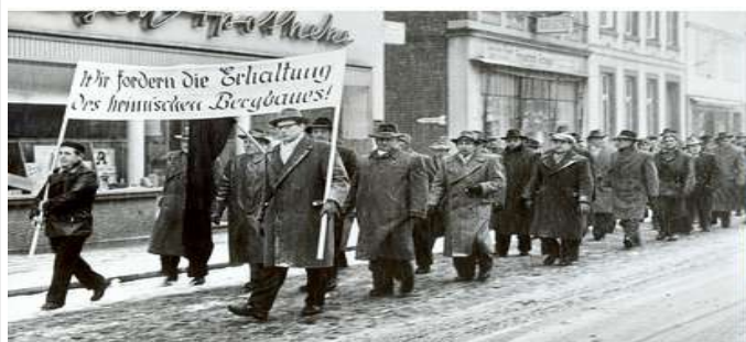
Demo für Erhalt 1960

Oberhalb der B65 wurde um 1900 der „Neue Beckedorfer Stollen“ aufgeföhren. Im Dorfe Kobbensen vielen die Brunnen leer, die Bergwerksbetreiber legten auf bitten der Dorfbewohner Wasserhaltungsstollen an. Rohrleitungen wurden verlegt, um den Missstand abzuwenden! Der Stollen ist heute dem Verfall preisgegeben.