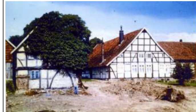
Meier-Hofstelle Nr. 1

37 und 38 An der Bückeburger Straße der Meierhof Nr.1 , - Rinnehof-, bis zu seinem Abriss in den 70er Jahren war dieser Hof eine besondere Zierde für den Ort. Ein großer Nussbaum, alte Eichen, prächtige Kastanien schmückten den Hofplatz. Außerdem befand sich auf dem Hof das älteste Schwefel-Schlammbadshaus Deutschlands.