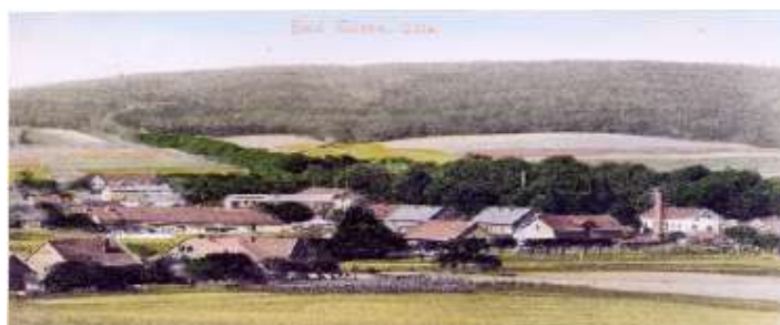
Villenviertel um 1915

20 (ohne Foto) Wir erreichen das Villenviertel , das um 1920 herum angelegt wurde. Das Haus Hannover besaß 1945 der erste von den Briten eingesetzte Bad Eilsler, Bürgermeister Theodor Göhns .