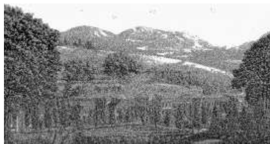
Ansicht von Eilsen mit Schlamm-Badehaus, um 1805

Das Foto zeigt außer dem Großen Logierhaus noch das erste Bettenhaus des Bades von 1805, das Kleine Logierhaus.