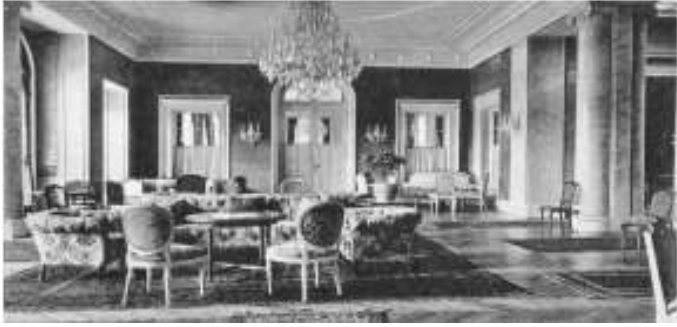
Grosser Wohnraum im Hotel Fürstenhof