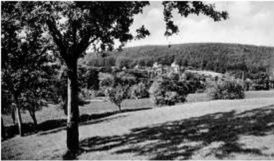
Landschaft bei Bad Eilsen mit Harriberg