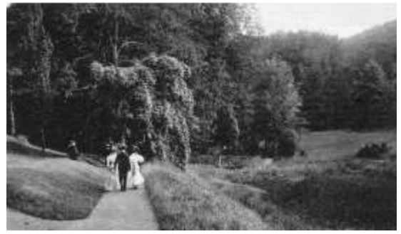
Waldpartie bei der Arensburg

Der Blick über den Kurpark erlaubt eine weite Aussicht bis auf die Abhänge der Bückeberge (auch Heeßer Berge genannt), was ganz im Sinne der auf weite Sichtachsen ausgerichteten Parkgestaltung war.