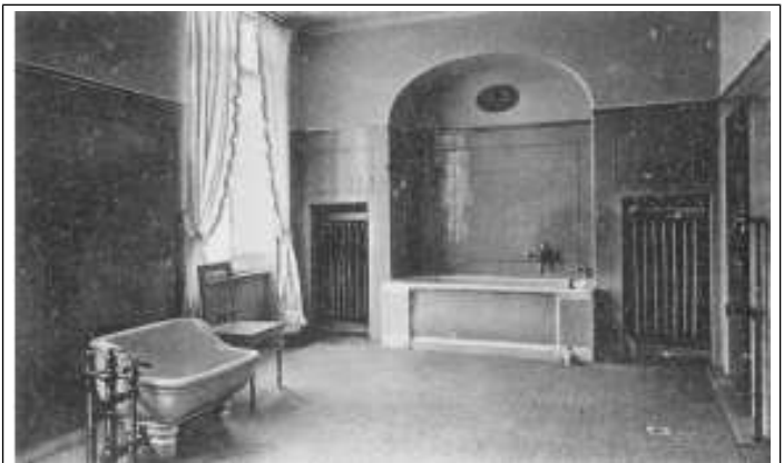
Luxus-Bad der 20-ziger Jahre

Das Haus enthielt einen großen und einen kleinen Speisesaal und wurde durch eine große Terrasse mit dem Kurhaus verbunden.