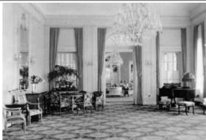
Musiksaal im Fürstenhof

Fürst Adolf weilte nach seiner Abdankung 1918 nur noch selten in seinem früheren Land Schaumburg-Lippe. Jedoch ließ er sich es nicht nehmen, jedes Jahr im Fürstenhof mit seiner Gattin längere Zeit im Fürstenhof zu verbringen .