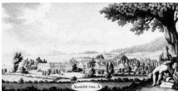
Kurpark mit Harrlallee im Hintergrund, um 1805

(Weiteres im Nieders. Staatsarchiv in Bückeburg unter der Signatur K2G 102)