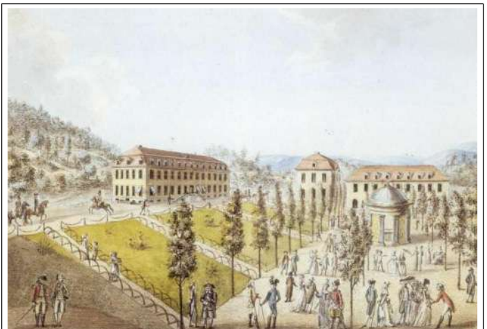
Auf der Esplanade um 1795

Die Trinkquelle wurde erstmals 1790 mit einem Tempel überbaut, „ein artiger achteckiger mit einer Kuppel gezielter Tempel in echtem römisch-architektonischen Geschmack“. 1842/43 wurde ein neuer Brunnentempel aus Sandstein im antikisierenden Stil errichtet. Frauen in Nenndorfer Tracht schenkten hier die Trinkkuren aus.