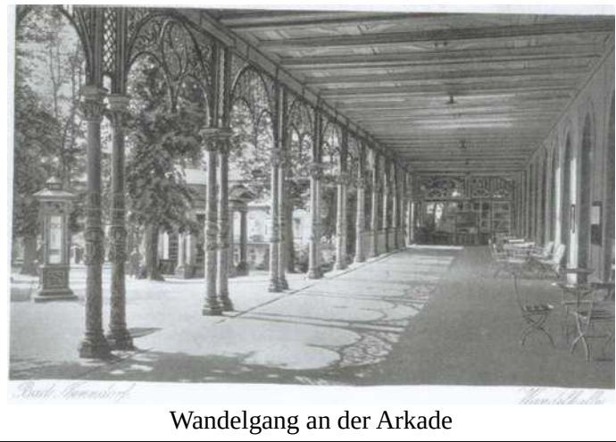
Wandelgang an der Arkade

Der Bau des Arkadengebäudes begann 1789. Es hatte im oberen Stockwerk 26 Logierzimmer. Im Erdgeschoss befanden sich ein Kursaal, weitere Zimmer und ein Arkadengang. Durch bedeutende Erweiterungen wurde letzterer 1856/57 zur Wandelhalle ausgebaut. Weitere Umbauten erfolgten in den 1920er und in den 1930er Jahren. 1959 wurde das Gebäude abgebrochen und durch einen Neubau ersetzt.