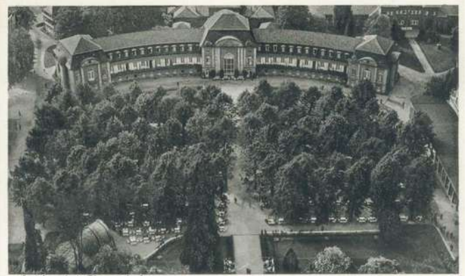
Bad Nenndorf, Liegewieseaufnahme

Von 1904 bis 1906 entstand an der Stelle des alten Großen Badehauses das neue Große Badehaus im Neo-Rokoko-Stil und bildete ein wesentliches Zentrum des Badebezirks. Wie im früheren Großen Badehaus befanden sich unten die Badeeinrichtungen und darüber die Fremdenzimmer. Die Kureinrichtungen in Bad Nenndorf, insbesondere das neue Große Badehaus, gehörten über Jahrzehnte zu den modernsten in Deutschland. Heute wird das Haus ausschließlich als Hotel genutzt.