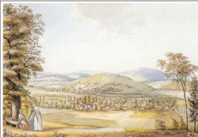
Vom Borkenhäuschen bot sich eine Aussicht auf 23 Dörfer.

Im Jahre 1792 wurde der Wilhelmshain angelegt. Landgraf Wilhelm IX. von Hessen-Kassel hatte diesen abgeschieden gelegenen Ort als seinen Lieblingssort auserkoren, in dem eine Eremitage, das Borkenhäuschen, achteckig im Grundriss und mit Eichenborke behängt, errichtet wurde. Von dort bot sich eine weitreichende Aussicht nach Südwesten auf nahezu 23 Ortschaften. Das Borkenhaus existiert nicht mehr.