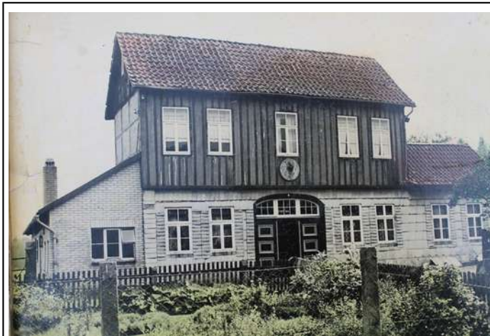
Wohnhaus der Kolonie um 1900

Den Colonisten, die ledig zu sein hatten und keine Güter besitzen durften, wurden Haus und Hof samt Gerätschaften und Saatgut für das erste Jahr geschenkt, allerdings mit der Auflage, innerhalb eines Jahres zu heiraten. Auch konnte der Besitz nur an die eigenen Kinder vererbt werden und fiel ansonsten an das Grafenhaus zurück.