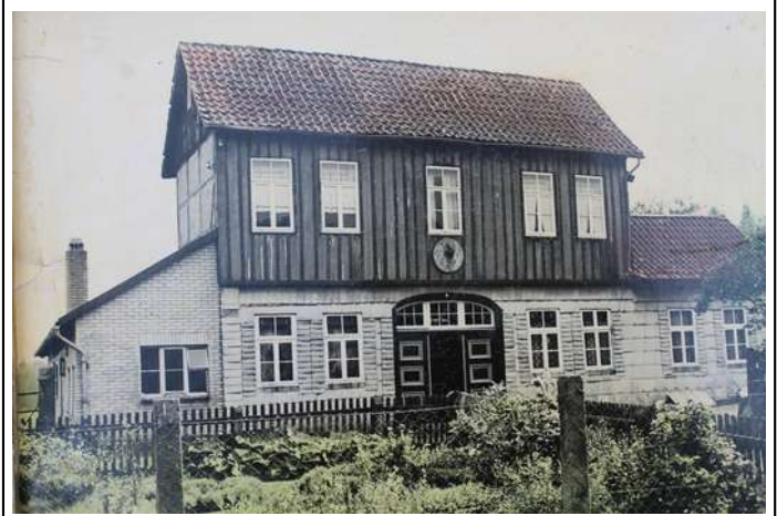
Wohnhaus der Kolonie um 1900

Den Colonisten, die ledig zu sein hatten und keine Güter besitzen durften, wurden Haus und Hof samt Gerätschaften und Saatgut für das erste Jahr geschenkt, allerdings mit der Auflage, innerhalb eines Jahres zu heiraten. Auch konnte der Besitz nur an die eigenen Kinder vererbt werden und fiel ansonsten an das Grafenhaus zurück.