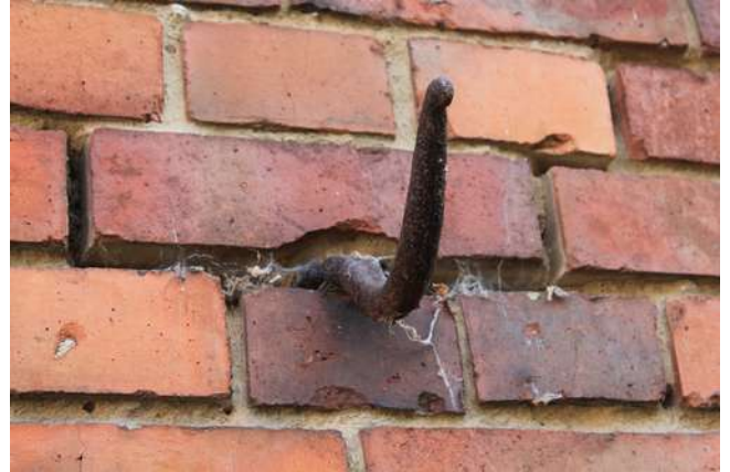
Fleischerhaken an der Rückseite der Scheune.