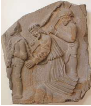
Kreuzwegsstation, an der Jesus unter dem Gewicht des Kreuzes zusammenbricht.

2 Mit dem Abriss der alten Althenäger Kirche wurde auch der Kirchhof, der diese umgab, geräumt und die historischen Grabsteine zusammen mit dem Abbruch für den Bau der Straße nach Steinhude verwendet. Deshalb sind nur wenige dieser Grabsteine erhalten geblieben, die entweder im Altarraum der Kirche eingemauert oder auf dem neuen Friedhof aufgestellt worden sind. Manche Grabsteine wurden auch auf die Höfe zurückgeholt.