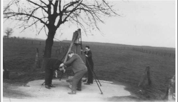
Dorfpumpe in Betrieb

Im Jahre 1893 wurde dieser Gemeindebrunnen unter schwierigsten Bedingungen infolge von Treibsand von Rieher Bergleuten ausgehoben. Bei längerer Trockenheit förderte diese Pumpe bis zum Bau der Wasserleitung im Jahre 1960 das lebensnotwendige Naß für Mensch und Tier.