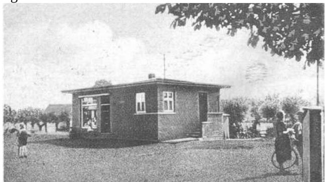
Gemischtwarenladen K. Steege am Allernkamp

Wie aus vorstehender „kleiner Ortsgeschichte“ hervorgeht, wurde unser Ort durch den Bergbau sehr stark geprägt. Dieses wird dadurch deutlich, das es seit 1899 hier einen Bergmannsverein gibt. Dieser „Hunt“ im Dorfmittelpunkt (Allernkamp) wird von zwei Findlingen mit den Emblemen des Sportvereins und der Feuerwehr eingerahmt.