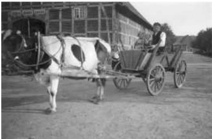
Heinrich Oltrogge auf der Fahrt zum Acker

Die Grundstücksfläche zu diesem Haus Nr. 38 ist sehr gering und wurde über 3 Generationen jeweils von einem Heinrich Oltrogge bewohnt.