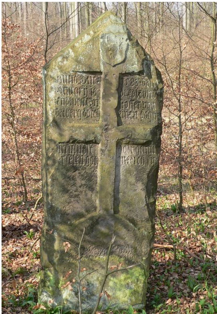
Wettbergstein: Einer der größten Steine der Region ist der Wettbergstein.