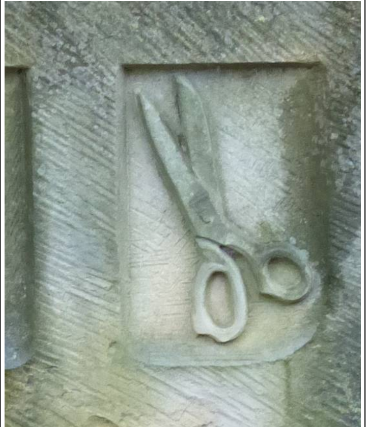
Die Schere als Hinweis auf die Mordgeschichte.