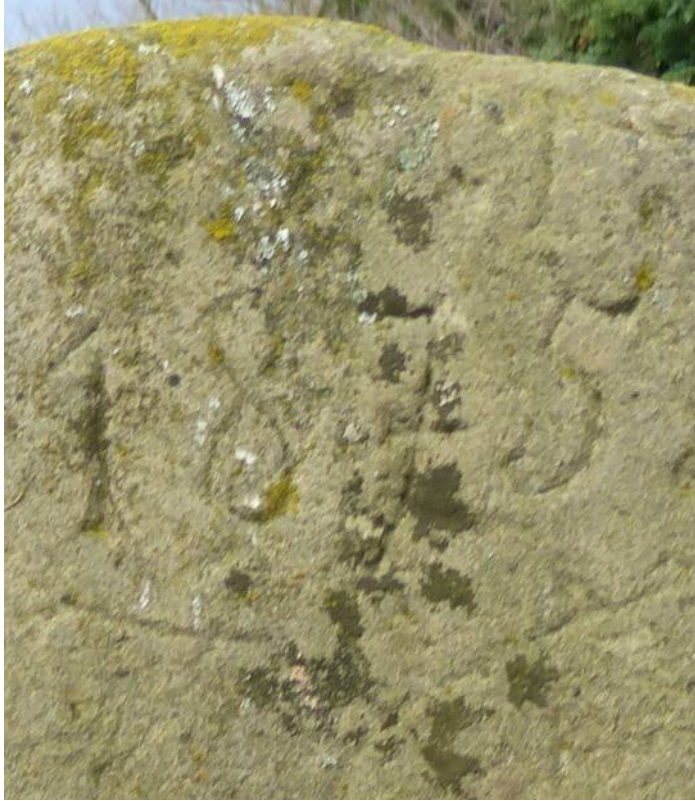
Stark verwittert: die Buchstaben KWP und die Jahreszahl 1875.

Am Fundort soll der im Volksmund irgendwann einmal so bezeichnete „Schwurstein“ oder auch „Blutstein“ errichtet worden sein, bis er als Bachsteg zweckentfremdet wurde. Neben den Initialen des Entdeckers von 1875 trägt der untere Teil der Rückseite die Buchstabengruppen H. W. M., H. K. M. und H. B. M. Es könnten die historischen Steinsetzer gewesen sein, wobei das M auf den Ortsnamen Messenkamp hindeuten würde. Ein Zeitungsbeitrag vom Juli 1939 datiert ohne nähere Quellenangabe das Ereignis auf das Jahr 1545.