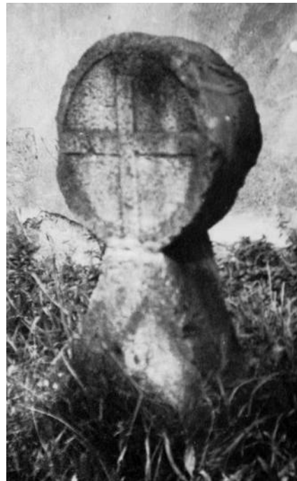
1943 ist das Scheibenkreuz von Beckedorf noch fotografiert worden.

Nur als Bild hat sich ein Scheibenkreuz erhalten, das ursprünglich am Maidamm zwischen Beckedorf und Horsten stand und 1935 an die Beckedorfer Kirche versetzt wurde.