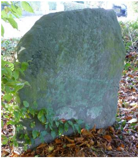
Die Rückseite ist stark verwittert.

Es ist sein dritter Platz nach seinen ursprünglichen Standorten an einem Weg in der Feldmark und später am Dorfausgang in Richtung Weibeck. In der Literatur lässt sich kein Hinweis auf die Bedeutung des Steins finden.